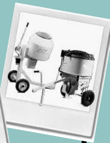
Fördertechnik f. Fertigputze, Mörtel und Sand; Spritz- und Beschichtungsmaschi- nen, Betonmischer