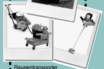
Raupentransporter, Steinsägen, Handrührwerke