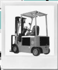
Walzen, Kompressoren, Rüttelplatten, Stapler