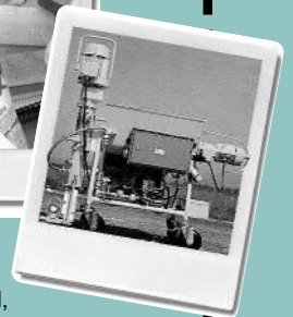
Fertigputze, Mauermörtel, Verputzmaschinen