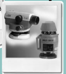
Bauheizgeräte, Raum-trock- ner, Vermessungs- und Nive- liergeräte