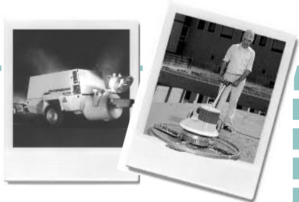
Estrich-, Beton- und Mörtelpumpen; Pumpen für Fertigputz, Sand- und Fließestrich, Mischgeräte, Glättmaschinen

Jäger GmbH - Treietstr. 2a A-6833 Klaus, www.jaeger.at Tel.: 05523/62726 Fax: 05523/62726 DW 2 info@jaeger.at