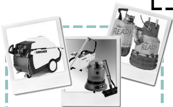
Reinigungsgeräte f. Maschinen, Auto, Gebäude, Was- ser- u. Tauchpumpen, Sprühgeräte, Hochdruck bis 500 bar